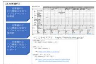
業務課題の見える化